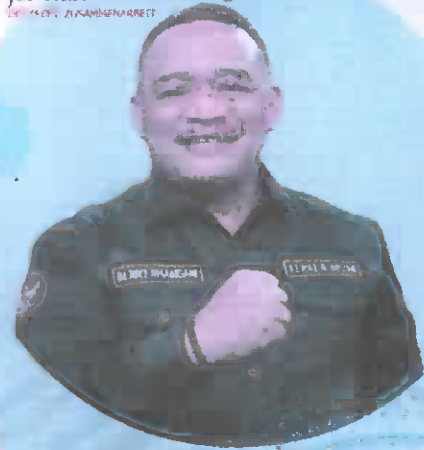
BENNY RHAMDANI Kepala Badan Pelindungan Pekerja Migran Indonesia (BP2MI)

Direktorat Penempatan Pemerintah Kawasan Eropa dan Timur Tengah